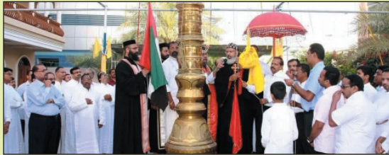
ഊശാന ശുശ്രൂഷ, കാതോലിക്കാ ദിനം എന്നിവയുടെ പ്രസക്ത ഭാഗങ്ങൾ